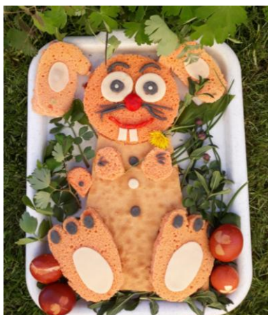
Ukázka velikonočního pečení klientů z azylového domu

Na azylovém domě jsme přivítali jaro velkým jarním úklidem, tak jako je zvykem v běžné domácnosti. Gruntovalo se ve všech pokojích, v kuchyních, přesadily se pokojové květiny, ale uklízelo se i v dalších společných prostorách azylového domu. Jarní údržby se dočkala také přilehlá zahrada s malým dvorkem, kterou klienti netradičně vyzdobili. Aktivní klienti, kteří rádi pracují na zahradě, vypleli skalku a do připravených záhonků zasadili cibuli, hrách, ředkvičky. Jako symbol květnových svátků byl vysazen šerifový keř, který věnovala pracovnice azylového domu. Velikonoční a májové svátky si klienti zpestřili vařením, pečením, velikonočními tradicemi a společenskými hrami pod vedením pracovníků. Sociální práce na azylovém domě vyžaduje mnoho trpělivosti a motivační podpory, těmito aktivitami se pracovníci také snaží o socializaci klientů, kteří jsou na okraji společnosti, a veřejností často vnímáni negativně.