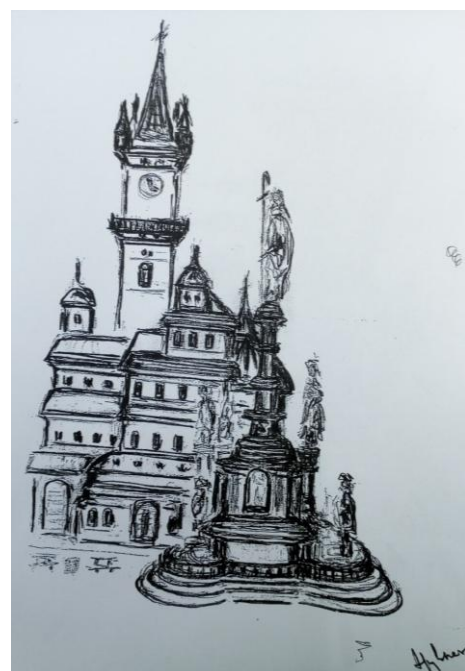
Mariánský sloup Neposkvrněné Panny Marie