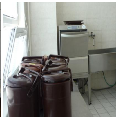
Prostor k mytí jídelnosičů