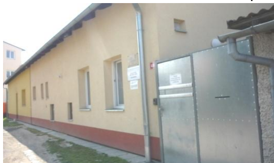
Azylový dům pro muže a ženy na ulici Malé Novosady Koupelna - muži