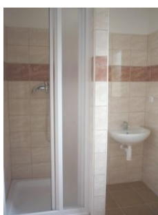
Noclehárna ženy – koupelna