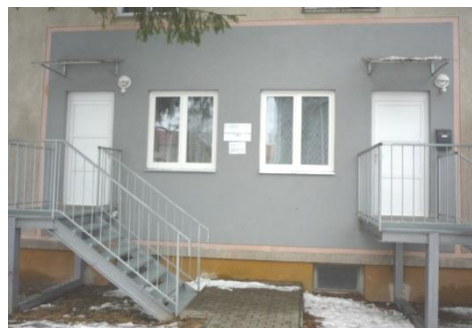
Domov pro matky s dětmi v tísni – ul. Pionýrů Kuchyň

K 31. 12. 2018 bylo v domově pro matky s dětmi v tísni evidováno 7 klientů (2 matky, 5 dětí). Sociální služby využily pouze ženy.