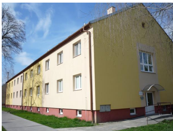
Dům zvláštního určení na ulici Bratří Čapků