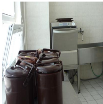
Prostor k mytí jídelnosičů