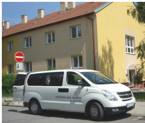
Služební vozidlo pečovatelské služby