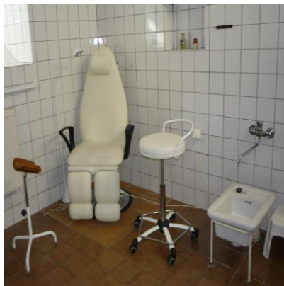
Středisko osobní hygieny – koupelna