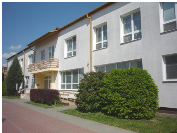
Dům zvláštního určení na ulici Gymnazijní