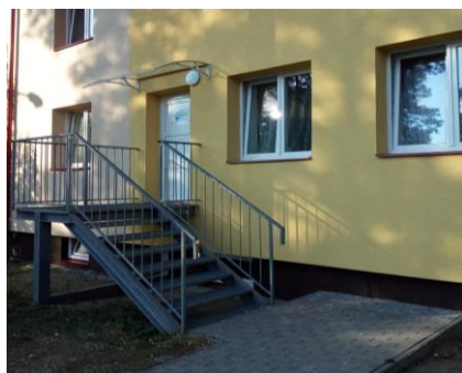
Domov pro matky s dětmi v tísni – ul. Pionýrů

K 31. 12. 2019 bylo v domově pro matky s dětmi v tísni evidováno 5 klientů (2 matky, 3 děti). Sociální služby využily pouze ženy.