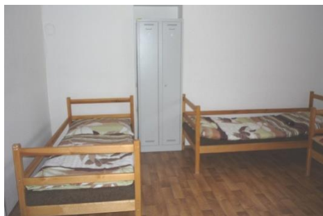
Noclehárna pro ženy – pokoj

Poskytované fakultativní činnosti: - praní prádla 15,- Kč za prací cyklus, - sušička 15,- Kč - počítač s internetem je zdarma.