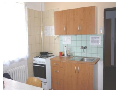
Kuchyň – muži