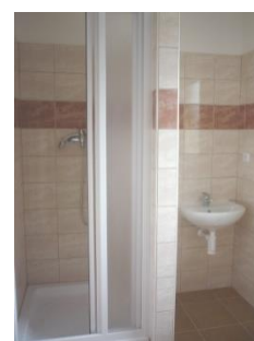
Noclehárna ženy – koupelna