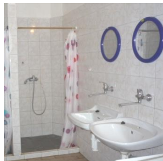
Koupelna - muži